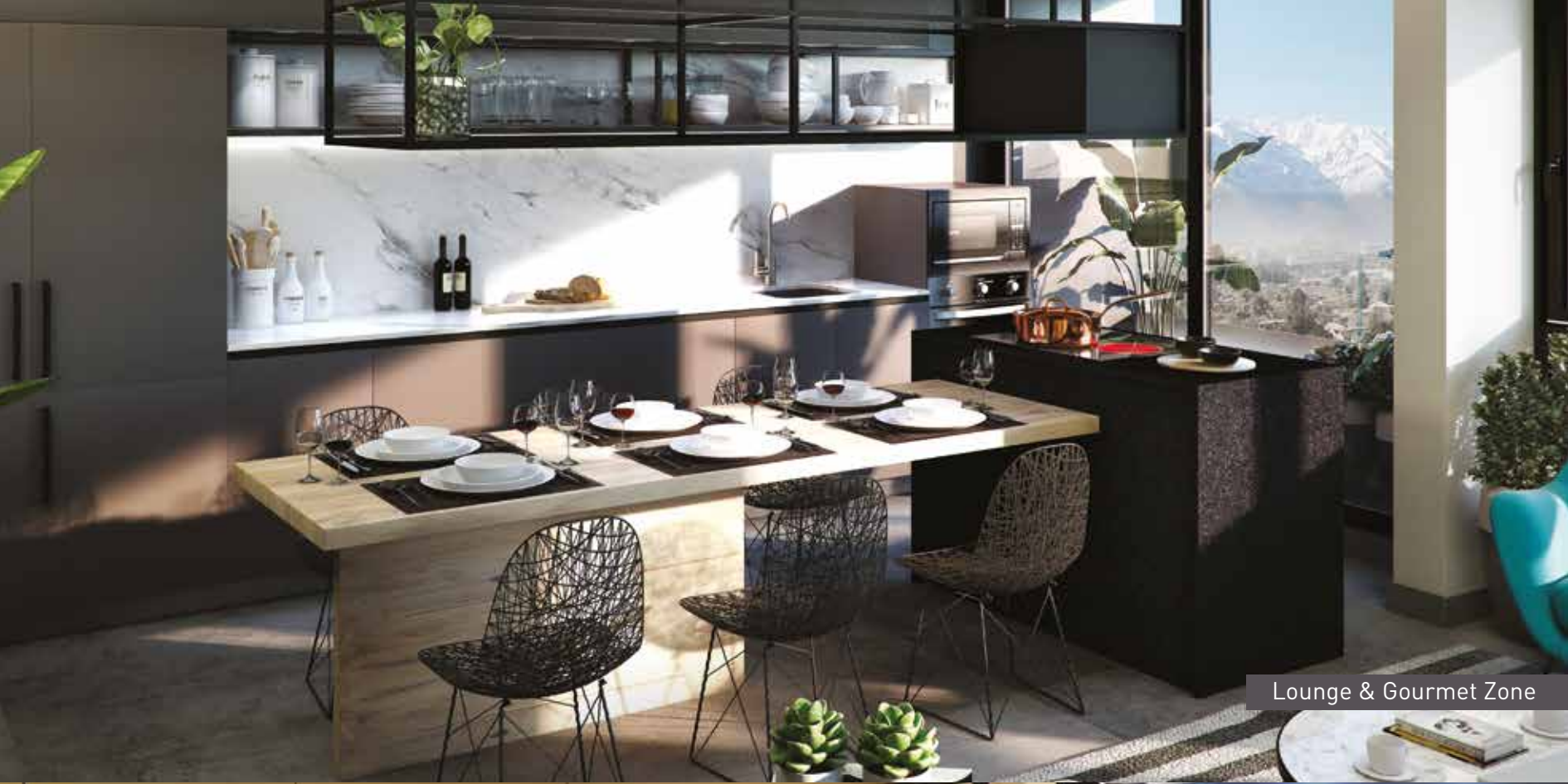
Lounge & Gourmet Zone