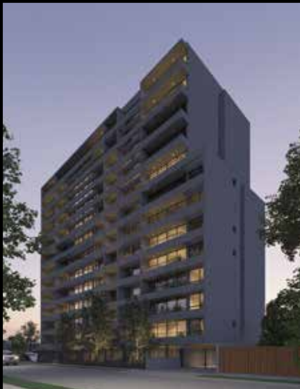
SUEÑA SANTA ELISA