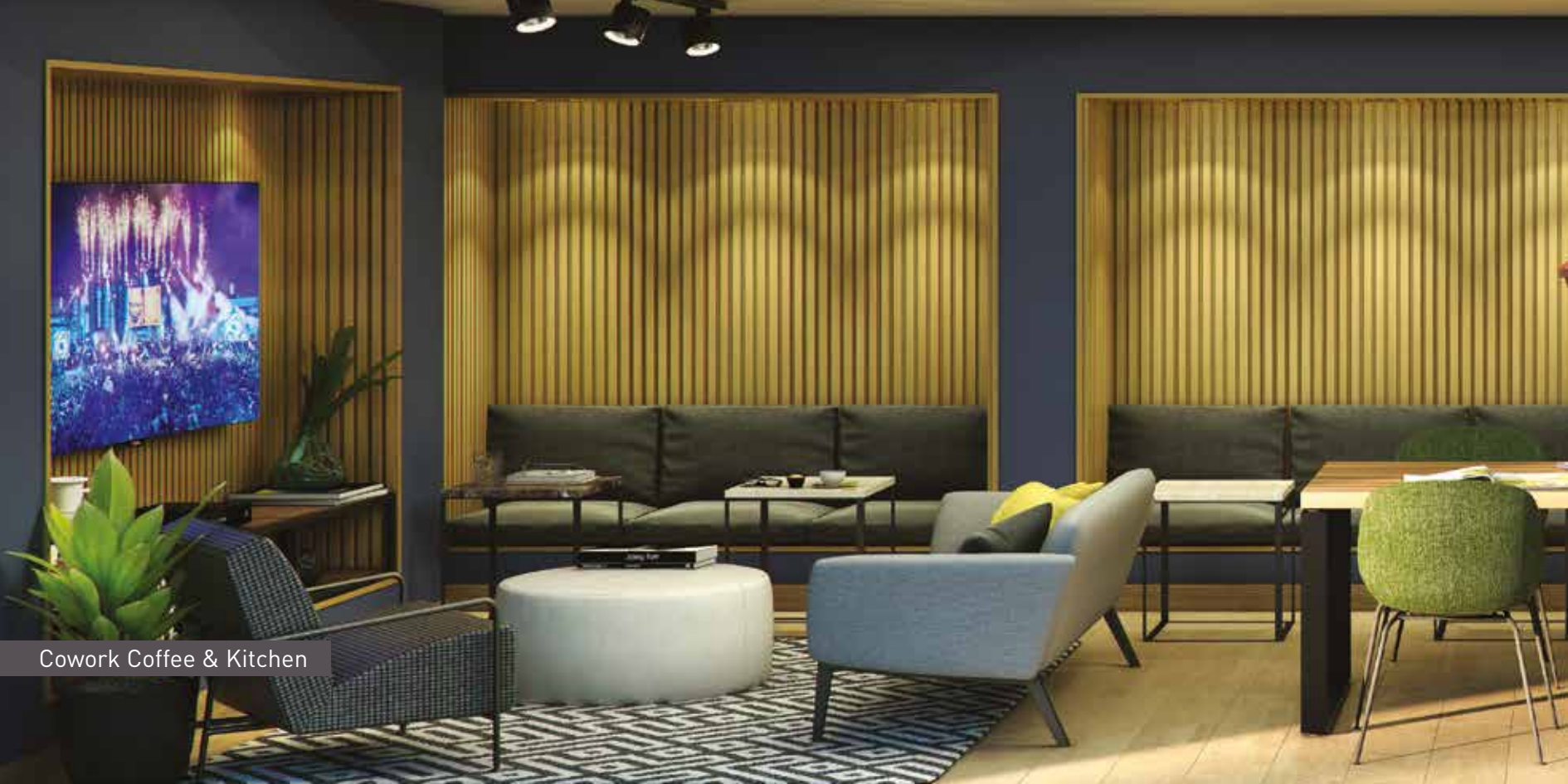
Cowork Coffee & Kitchen